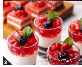
3 ハリーのヴェレリヌ