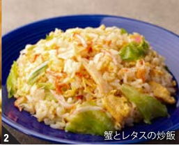
2 蟹とレタスの炒飯