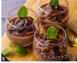
3 チョコレートプリン

身体の芯から温まる料理をご用意。味噌のコクがきいたラーメンや深みのあるソースの肉料理で滋養をつけ、春の訪れに耳を傾けながら身体と心を整えて。