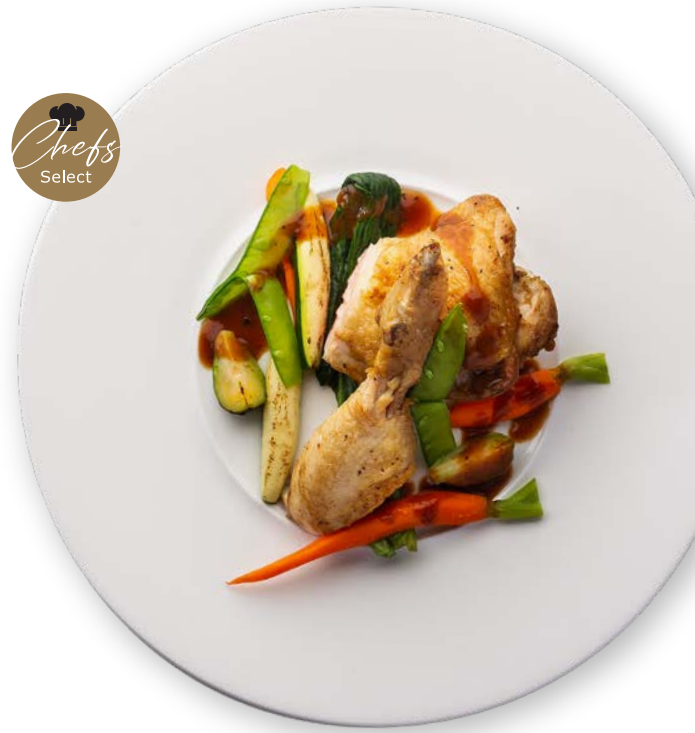
骨付きモモ肉のロースト トリュフクリーム