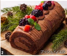
2 ブッシュドノエル